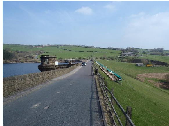
Dämme am Riding Wood Reservoir (links) und Digley Reservoir (rechts), Großbritannien

Der Damm des Riding Wood Reservoirs wurde 1878 gebaut und hat ein Speichervolumen 235.000 m 3 Wasser. Das Reservoir wird durch einen ungefähr 21 m hohen Erddamm mit einem Tonkern gestaut. Es gehört zu einem der vier Reservoirs im Holms Valley, welche die Holmbridge Wasseraufbereitungsanlage versorgen. Nach einer Rutschung an der Luftseite des Damms im Jahre 2012 wurden Temperatursondierungen luftseitig vom Tonkern installiert und für die Verwendung als Langzeit-Sickerwasserüberwachungssystem eingerichtet. Ziel des Überwachungssystems ist es, mögliche Durschsickerungen durch den Tonkern frühzeitig zu erkennen. Dafür wurden ungefähr 1090 m faseroptisches Hybridkabel verlegt. Für die Heat-Pulse-Methode kann das Hybridkabel, bestehend aus Glasfasern und Kupferleitern, zur Temperaturmessung und zum Aufheizen genutzt werden.