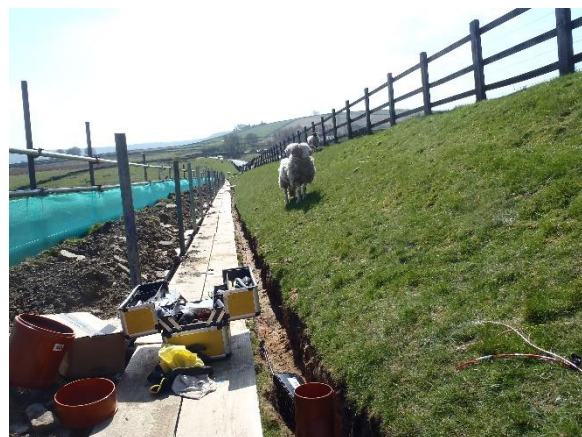
Verlegung der Glasfaserkabel am Digley Reservoir Damm