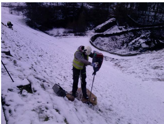
Installation der Temperatursondierungen im Damm des Riding Wood Reservoirs

Der Damm des Riding Wood Reservoirs wurde 1878 gebaut und hat ein Speichervolumen 235.000 m 3 Wasser. Das Reservoir wird durch einen ungefähr 21 m hohen Erddamm mit einem Tonkern gestaut. Es gehört zu einem der vier Reservoirs im Holms Valley, welche die Holmbridge Wasseraufbereitungsanlage versorgen. Nach einer Rutschung an der Luftseite des Damms im Jahre 2012 wurden Temperatursondierungen luftseitig vom Tonkern installiert und für die Verwendung als Langzeit-Sickerwasserüberwachungssystem eingerichtet. Ziel des Überwachungssystems ist es, mögliche Durschsickerungen durch den Tonkern frühzeitig zu erkennen. Dafür wurden ungefähr 1090 m faseroptisches Hybridkabel verlegt. Für die Heat-Pulse-Methode kann das Hybridkabel, bestehend aus Glasfasern und Kupferleitern, zur Temperaturmessung und zum Aufheizen genutzt werden.